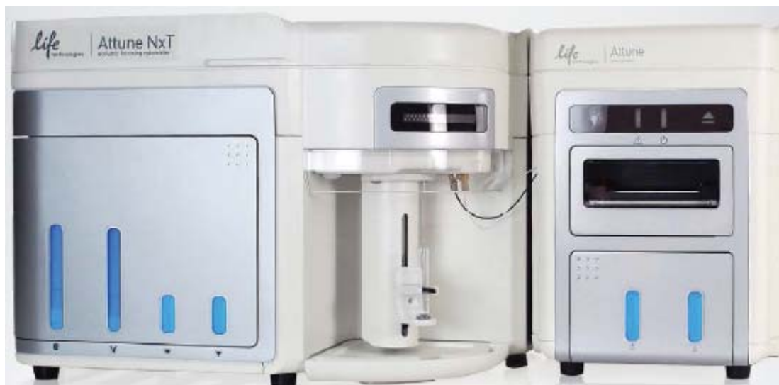
Рисунок 1 – Проточный цитометр Attune NxT

Attune® NxT – компактный настольный цитофлуориметр, использующий революционную технологию акустической фокусировки клеток для многопараметрического цитометрического анализа. Модульный дизайн позволяет использовать от 1 до 4 лазеров с возможностью детектирования до 14 цветов. Высокая скорость получения результатов – скорость детекции до 35 000 соб/сек, без потери качества данных. Детекция редких событий и работа с образцом без дополнительной пробоподготовки, благодаря высокой пропускной способности (до 4 мл/мин). Программное обеспечение для всех уровней пользователей. Малый размер позволяет разместить прибор в любом месте лаборатории. Дополнительный модуль Attune® Autosampler позволяет использовать для подсчета 96- и 384-луночные планшеты.